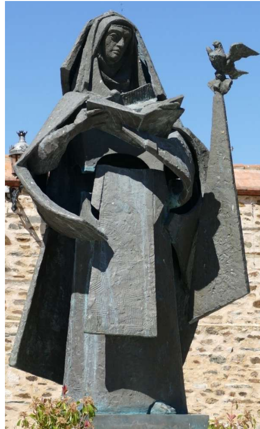
Theresia mit Geist-Taube, Bronzeplastik in Alba de Tormes. Dort befindet sich ihr Grab.

Aus dem reflektierenden Nachdenken über diese Kontakte in den einzelnen Einrichtungen werden wir neue Wege entdecken und gehen.