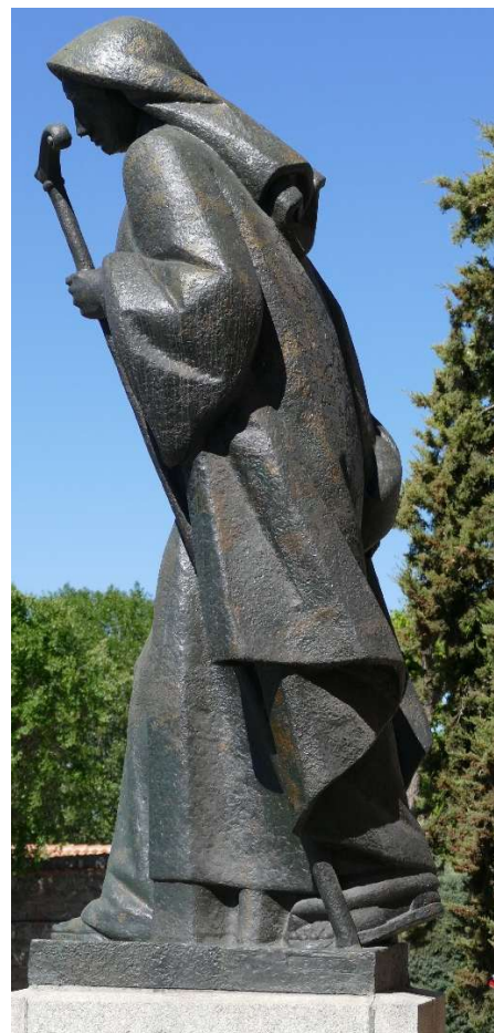
Bronze-Plastik der Heiligen Theresia vor dem Menschwerdungskloster in Ávila, Dort trat sie als junge Frau ein. Von dort brach sie nach ca. 20 Jahren auf zu ihren Neugründungen. (vgl. auch das Deckblatt)

St. Marien ist ein besonderer, ein offener Raum: der Kirchgarten lädt zum Verweilen und zur Begegnung ein, die tagsüber offene Kirche zur Einkehr.