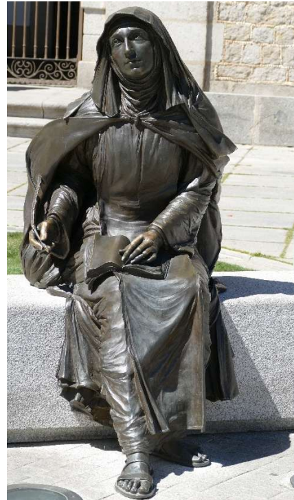
Theresia, Bronzeplastik vor ihrem Geburtshaus

- Sobald wir aus unserem Meldewesen von der Geburt eines Kindes erfahren, erhalten die Eltern ein Glückwunschs Schreiben. Dies ist uns nur dort möglich, wo mindestens ein Elternteil katholisch ist. Darin weisen wir auf die Möglichkeit