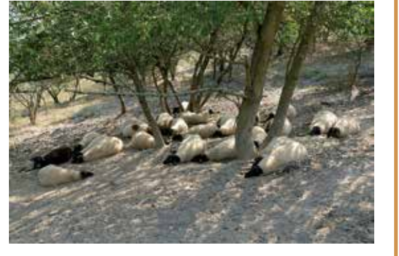
zum Titelbild: "Du bist behütet!"

Ruhig liegen diese Schafe im Schatten und strecken alle viere von sich. Sie sind satt und hatten genug zu trinken. Es fehlt ihnen an nichts. Sie können sich ablegen und ausruhen.